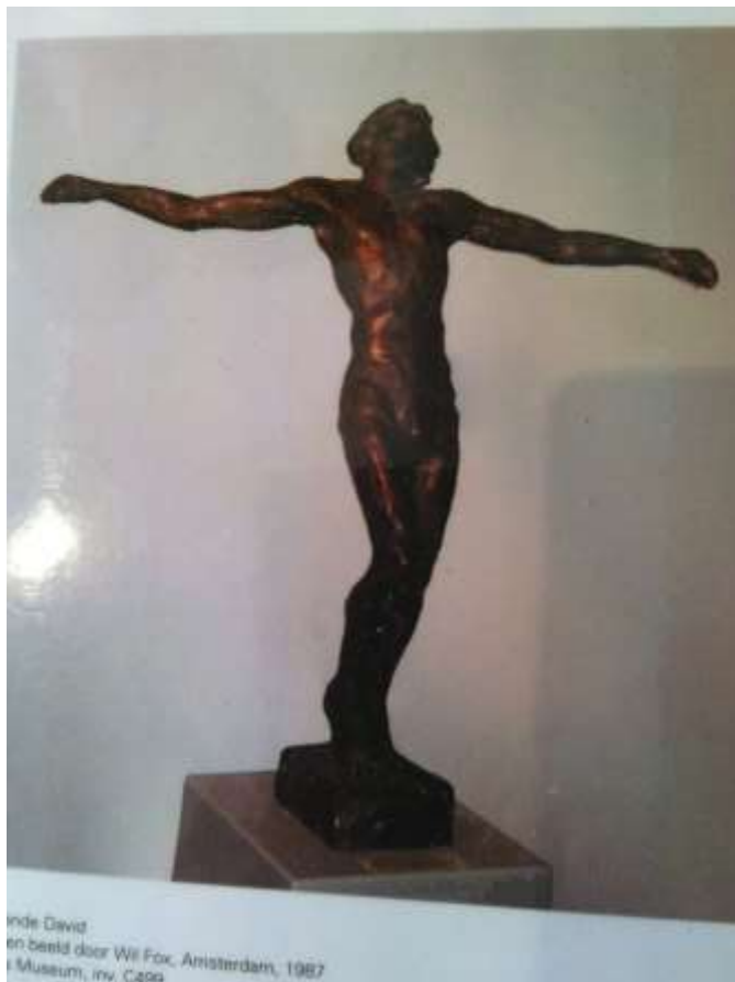
De Zoon van David een beeld door Wil Fox, Amsterdam, 1967 Rijksmuseum, inv. C499